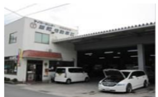
□本社 修理 保険 阪和自動車株式会社 有田郡有田川町庄406 0737-52-2090

～安心と信頼が標準装備～ お世話になった皆様にお客様をご紹介 頂けるような販売を心掛けています ～ALLメーカー取扱い～