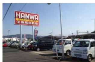
□展示場 販売 買取 マイカーセンター HANWA 有田郡有田川町国道沿い 0737-52-5231