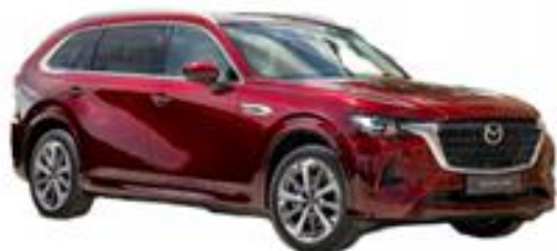
写真は欧州仕様車