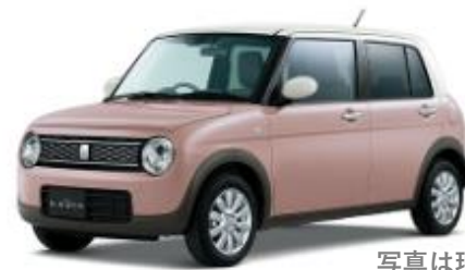
写真は現行モデル