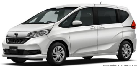
写真は現行モデル