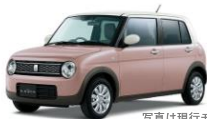
写真は現行モデル