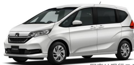
写真は現行モデル

人気のコンパクトミニバンがキープコンセプトで進化。発売は夏に延びるかもしれないです。