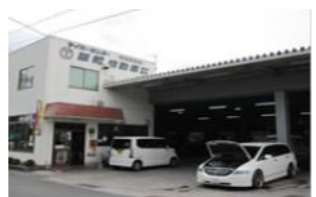
□本社 修理 保険 阪和自動車株式会社 有田郡有田川町庄406 0737-52-2090

～安心と信頼が標準装備～ お世話になった皆様にお客様をご紹介 頂けるような販売を心掛けています ～ALLメーカー取扱い～