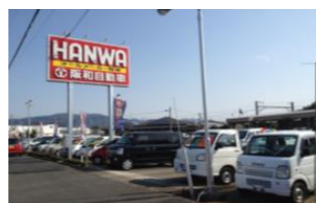
□展示場 販売 買取 マイカーセンター HANWA 有田郡有田川町国道沿い 0737-52-5231