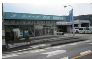
□車検場 車検 修理 サービスセンター HANWA 有田市糸我町中番250 0737-88-2090