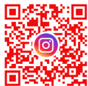
ほぼマルコのインスタ