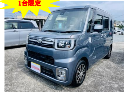
トヨタ ピクシスメガ660G ターボSA II