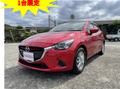
マツダ デミオ1.3 13Sツターリング