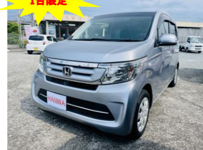
ホンダ N-WGN660G Lパッケージ