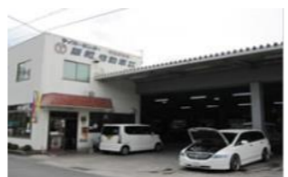
□本社 修理 保険 阪和自動車株式会社 有田郡有田川町庄406 0737-52-2090

～安心と信頼が標準装備～ お世話になった皆様にお客様をご紹介 頂けるような販売を心掛けています ～ALLメーカー取扱い～