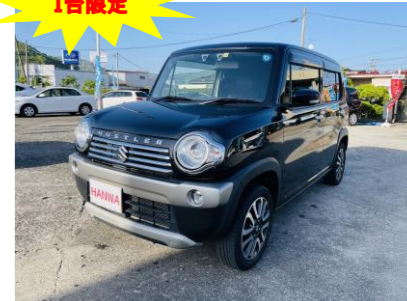
スズキ ハスラー660 Jスタイル II