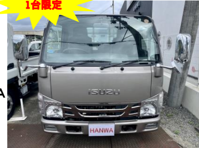
いすゞ エルフ2トントラック 全低床