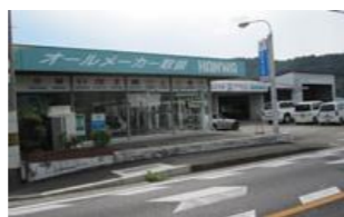
□車検場 車検 修理 サービスセンター HANWA 有田市糸我町中番250 0737-88-2090