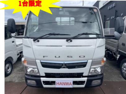
三菱 キャンター2トントラック 全低床(後期モデル)