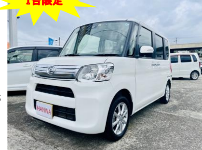
ダイハツ タント660G SA III