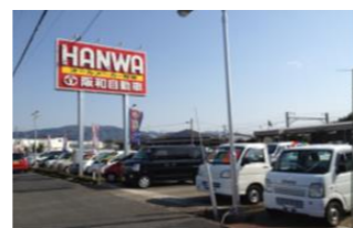
□展示場 販売 買取 マイカーセンター HANWA 有田郡有田川町国道沿い 0737-52-5231