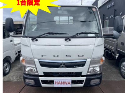
三菱 キャンター2トントラック 全低床(後期モデル)