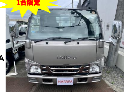
いすゞ エルフ2トントラック 全低床