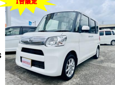
ダイハツ タント660G SAIII