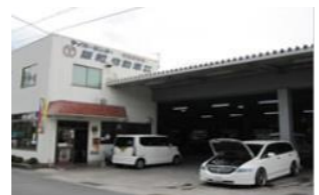
□本社 修理 保険 阪和自動車株式会社 有田郡有田川町庄406 0737-52-2090

～安心と信頼が標準装備～ お世話になった皆様にお客様をご紹介 頂けるような販売を心掛けています ～ALLメーカー取扱い～