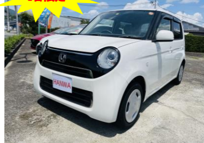
ホンダ N-ONE 600G