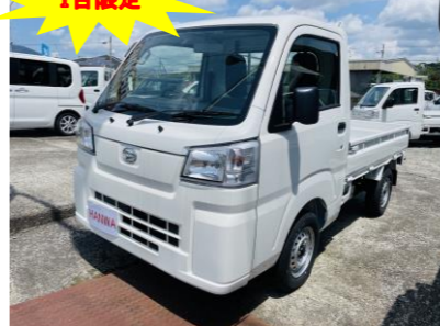
ダイハツ ハイゼットトラック スタンダード農用スペシャル