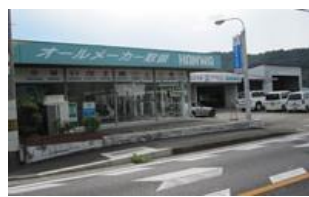
□車検場 車検 修理 サービスセンター HANWA 有田市糸我町中番250 0737-88-2090