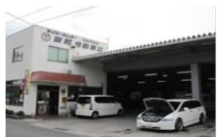
□本社 修理 保険 阪和自動車株式会社 有田郡有田川町庄406 0737-52-2090

～安心と信頼が標準装備～ お世話になった皆様にお客様をご紹介 頂けるような販売を心掛けています ～ALLメーカー取扱い～