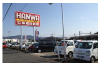
□展示場 販売 買取 マイカーセンター HANWA 有田郡有田川町国道沿い 0737-52-5231