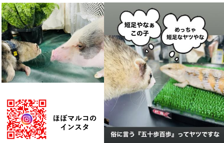
短足やなあこの子 めっちゃ短足なヤツやな