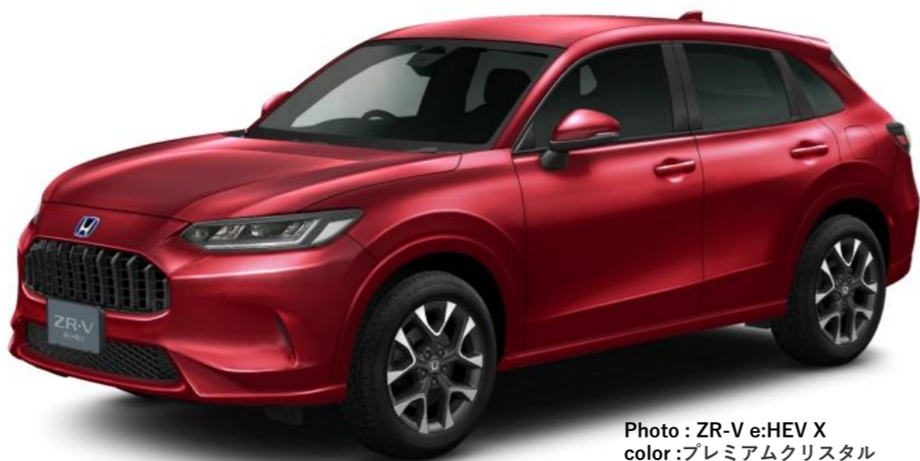
Photo: ZR-V e:HEV X color:プレミアムクリスタル ガーネット・メタリック グレードX (ガソリン) : 2,949,100円~ / e:HEVX (ハイブリッド) : 3,899,500円~