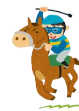
(ネットで拾ったネタです)

うちの息子も小学1年生。 さっそく、学校で初テストをうけてきた。 問「おさかなは、1びき2ひき、とりは1わ2わと数えます。では、うまは？」 答「1ちゃく2ちゃく」 さすが我が息子です・・・