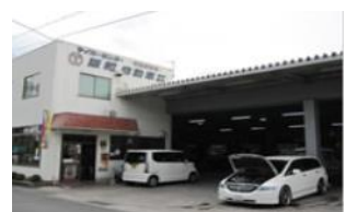
□本社 修理 保険 阪和自動車株式会社 有田郡有田川町庄406 0737-52-2090

～安心と信頼が標準装備～ お世話になった皆様にお客様をご紹介 頂けるような販売を心掛けています ～ALLメーカー取扱い～