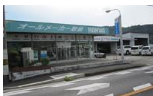
□車検場 車検 修理 サービスセンター HANWA 有田市糸我町中番250 0737-88-2090