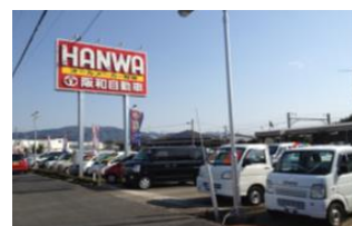
□展示場 販売 買取 マイカーセンター HANWA 有田郡有田川町国道沿い 0737-52-5231