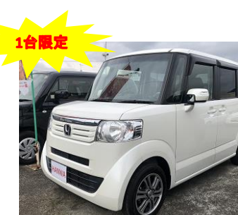
ホンダ N BOX GLパッケージ