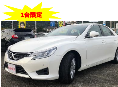
トヨタマークX 250G Fパッケージ