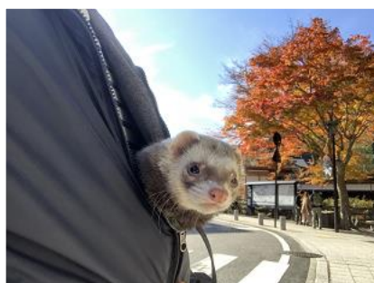
【寒いのでずんだれさんの懷の中でホカホカ】