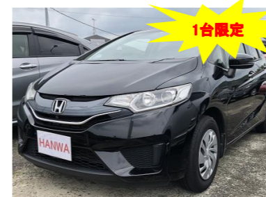
ホンダ フィット 13G Lパッケージ

阪和自動車の在庫車情報は、 こちらのQRコードからもご確 認いただけます(カーセンサー のサイトにつながります)。