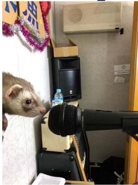
某スタジオにて(7月初旬撮影)

フェレット(イタチ科)のペレです!7月のフェスに向けて、歌の練習をしようと思ったのですが、ずんだれパンダさんの音痴な子守唄のせいでイラも相当な音痴になってしまっでござるよ。トホホでござるな~。