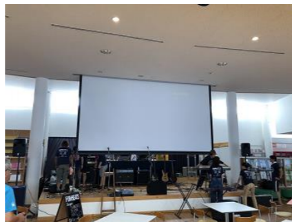
(開演準備中の写真)

このイベント、名をかえ、場所をかえ、今回で3回目の開催になります。前回までは、見るほうだったのですが、今回から、参加させていただきました。「踊る阿呆に見る阿呆」って阿波踊りの歌いだしがありますが、“やる”のと“みるで”は、やっぱり大違い。僕のMCの出来はちょっとした黒歴史の1ページになりましたが、でも、参加させてもらえてほんと良かったです。学生時代、演劇をやっていたのですが、久しぶりに、みんなで一つのことを作り上げる楽しみにふれることができました。来年も開催すると思いますので、その際は、ぜひ、皆さんもお越しくださいませ。では、今月も<_>>